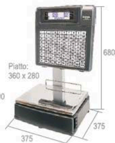
Dimensioni in mm.