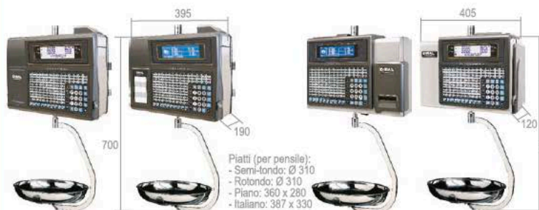
Piatti (per pensile): - Semi-fondo: Ø 310 - Rotondo: Ø 310 - Piano: 360 x 280 - Italiano: 387 x 330