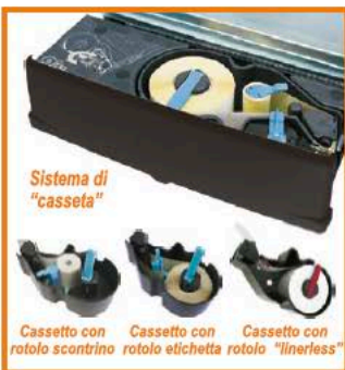
Sistema di "casseta"